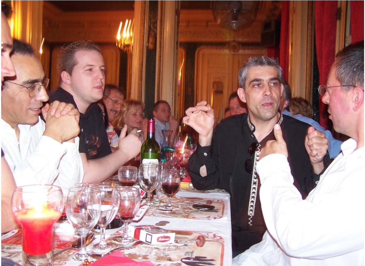
Arrivée du gâteau d'anniversaire avec ses bougies.